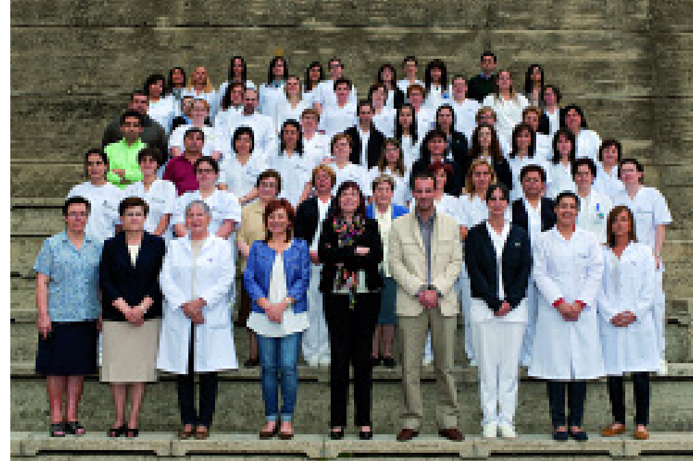
Equipo multidisciplinar del Centro Pai Menni