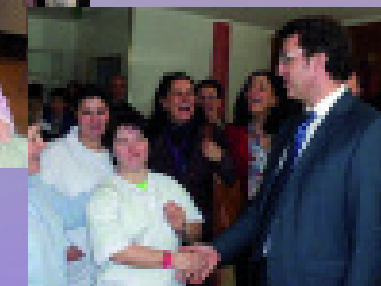
Núñez Feijóo saludó personalmente a las usuarias del Centro Pai Menni